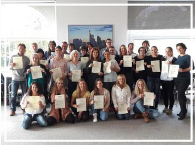
Glückliche Jahresausbildung mit Zertifikaten