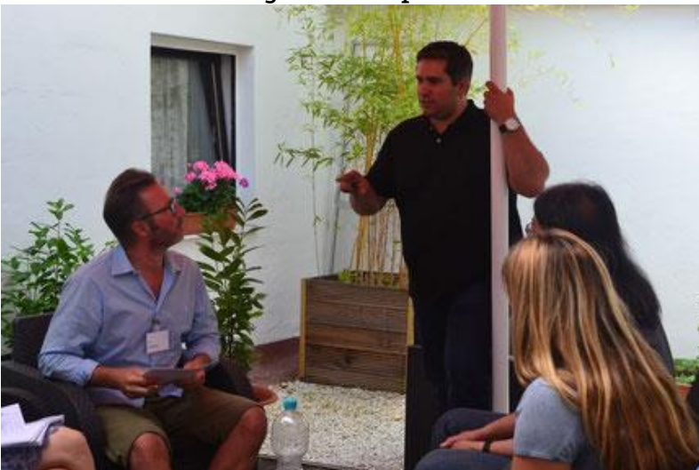
Mit Menschen arbeiten

Durch meine Gabe, die Teilnehmer in erhöhte Bewusstseinszustände zu bringt, werden deren mediale, spirituelle und geistheilenerische Fähigkeiten gesteigert. Die Teilnehmer erfahren zusätzlich tiefgreifende Techniken der Geistheilung und Wissen aus dem englischen Spiritualismus und dem brasilianischen Spiritismus.